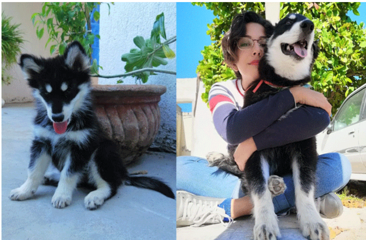
Ganadora del concurso 2022 con fotografía del perrito “Ramón”.

Ve fotos de participantes y ganadores del concurso 2022 AQUÍ .