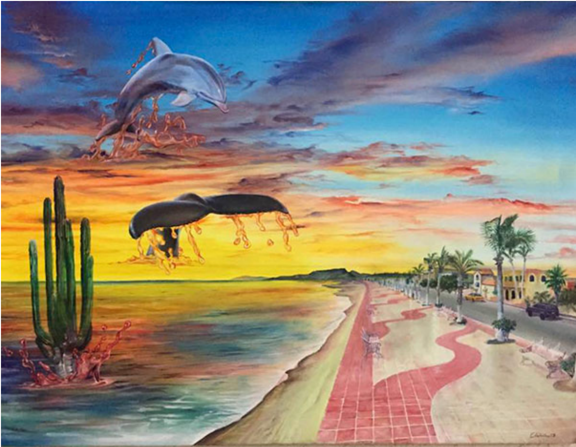
“Malecón” de Edil Rodríguez.

Si ya de por sí no cabemos de desempleo, y de mala vibra como ratas de laboratorio estresados por la chicharra de Chedraui o con la voz de Mary Carmen Cortés en Radio Fórmula hablando de finanzas cual navajas atravesadas en su gáznate, ahora hay que agregarle al escenario el continuo riesgo de caer, si en tu nave vas, en una zanja por la ausencia de tapas de alcantarillado puesto que vivimos en el peor lugar del planeta. Ni con narcomantas de ‘Pa’que aprendan a respetar’ se va a controlar esto. Los zombis voluntarios de picaderos paceños son capaces de robar y traficar por foco o chucky en nuestro industrioso mercado negro, coludidos con nuestros agentes dignos de cualquier episodio Unidad de Casos Especiales Olas Altas, Laguna Azul, Sobaco del Diablo, porque bien que permiten el negocio de venta de objetos robados en casas de empeño junto a casinos y el noble, nobilísimo reciclaje de metal fierro. Ya se acabaron todo el cableado de cobre de cuanta casa que lo poseía, ya se beneficiaron los vendedores de pvc, hasta el hotel Los Arcos desmantelaron ante