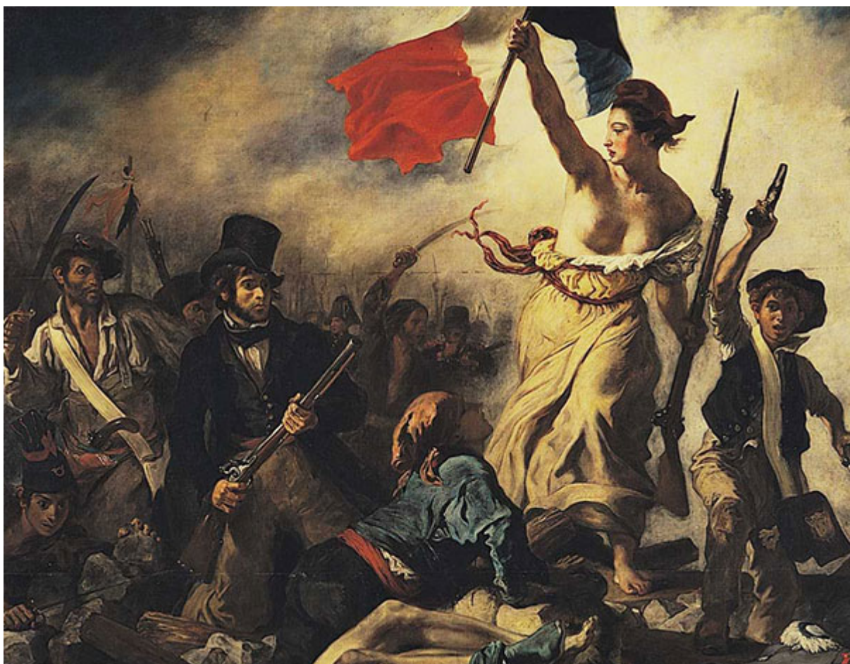
IMAGEN: EUGÈNE DELACROIX