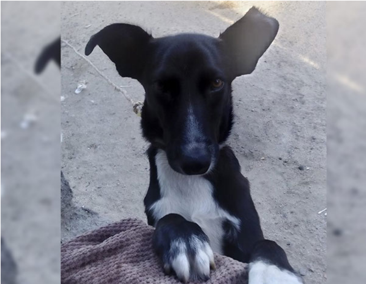
Perrito: "Snoopy". Publicado por: Ángel H. García. Mensaje "Fallecido el 17 de Julio del 2018".