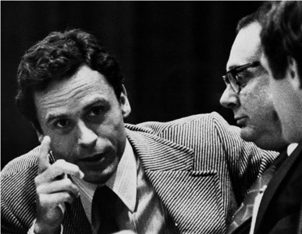
Ted Bundy en su juicio.

El término “ asesino serial ”, alcanzó fama internacional gracias en gran parte a la difusión que se le dio a la investigación de los crímenes cometidos por Ted Bundy , pues su captura fue ampliamente publicitada, así como las entrevistas que se le realizaron durante su proceso judicial . En una de las entrevistas más difundidas, Bundy afirma que la mejor manera de disfrutar del sexo era esposar a una mujer atractiva, aterrorizarla y convencerla de que iba a morir.