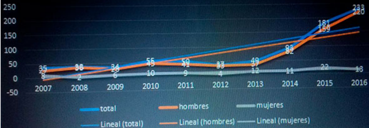
Grafica 2 HOMICIDIOS EN BAJA CALIFORNIA SUR POR MUNICIPIO, 2007-2016