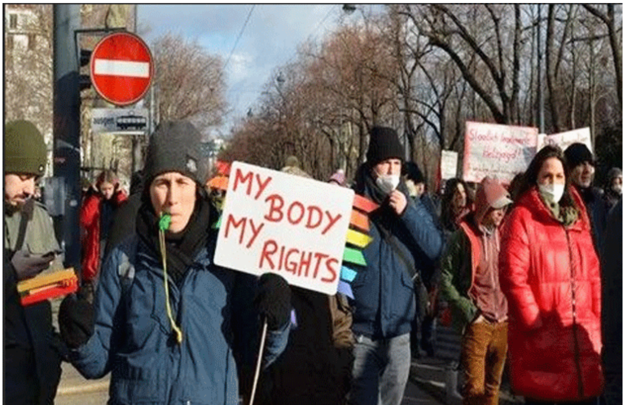
Una manifestación en contra de las medidas en Viena, el invierno de 2021.

El debate entre los que están a favor de las vacunas y los que están en contra se intensificó con la pandemia. En todo el orbe, científicos y médicos siguen discutiendo contra otros científicos y médicos a favor o en contra, mientras que grupos fanáticos toman acciones. El debate científico se vulgarizó como todo en esta época. Figuras públicas, burócratas, atletas profesionales y más, se alzaron en contra de la vacunación. El debate se volvió político.