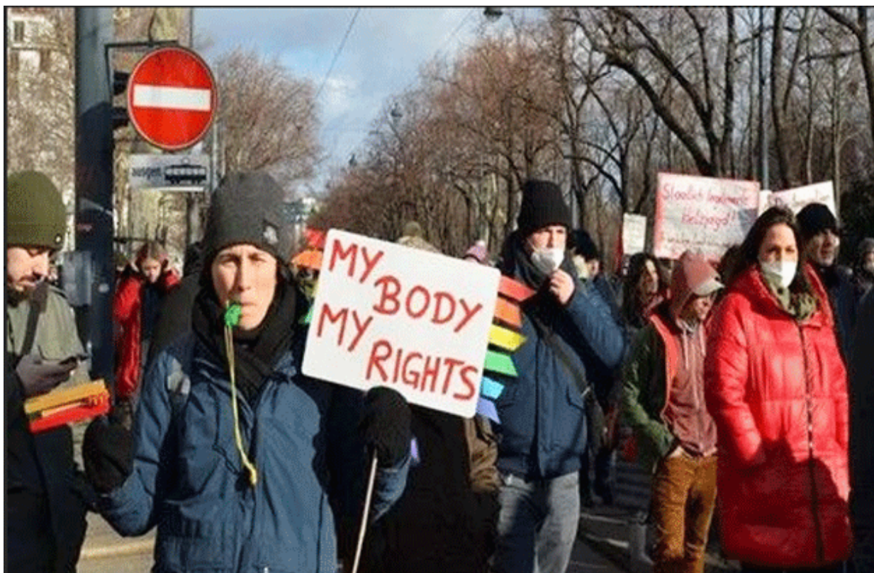
Una manifestación en contra de las medidas en Viena, el invierno de 2021.

El debate entre los que están a favor de las vacunas y los que están en contra se intensificó con la pandemia. En todo el orbe, científicos y médicos siguen discutiendo contra otros científicos y médicos a favor o en contra, mientras que grupos fanáticos toman acciones. El debate científico se vulgarizó como todo en esta época. Figuras públicas, burócratas, atletas profesionales y más, se alzaron en contra de la vacunación. El debate se volvió político.