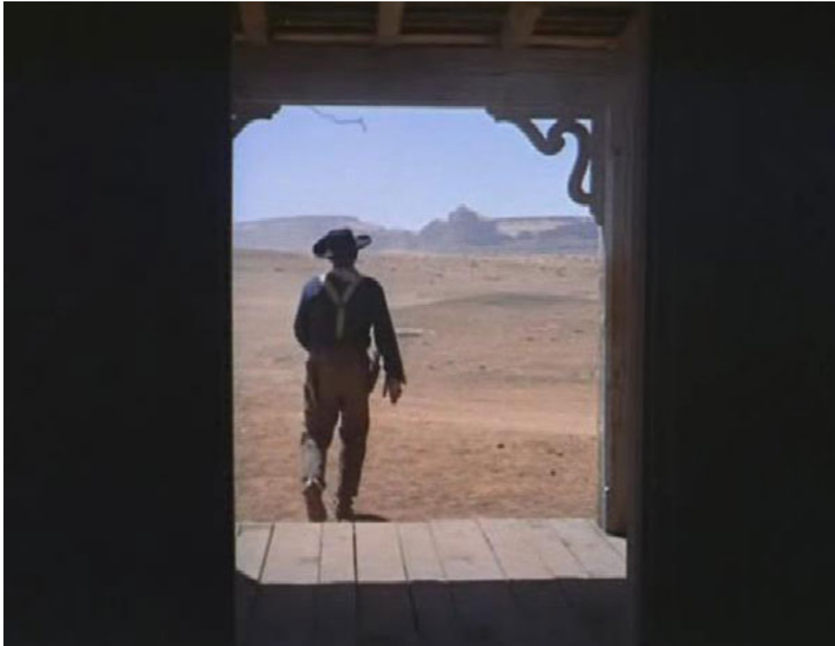
Imagen final de The Searchers (1956) protagonizada por John Wayne.

Algunos de los mejores Western hablan sobre la amistad de dos vaqueros y el cambio de una época: Red River , The Searchers o Butch Cassidy and the Sundance Kid son algunos ejemplos.