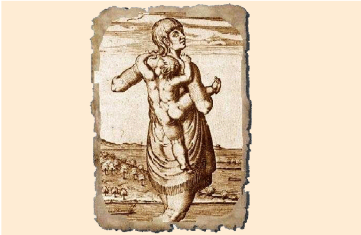
FOTO: Mujer pericúe

Otro punto importante a mencionar, y que actúa a favor de los trabajadores que eran nuestros Californios , es que, además de dedicar una buena parte de las primeras horas del día a recolectar alimento; el resto del tiempo lo dedicaban a prácticas sociales, políticas y religiosas , elaborando complejos rituales y ceremonias , las cuales se conocen en la actualidad gracias a las escuetas referencias que quedaron en ciertos diarios e informes. Se ha podido encontrar una gran cantidad de pinturas rupestres y petroglifos a todo lo largo y ancho de nuestra península, lo que nos da cuenta de la laboriosidad de nuestros indígenas , los cuales destinaban largas horas del día e incluso varios días para realizar estas manifestaciones culturales que afortunadamente han podido llegar hasta el presente.