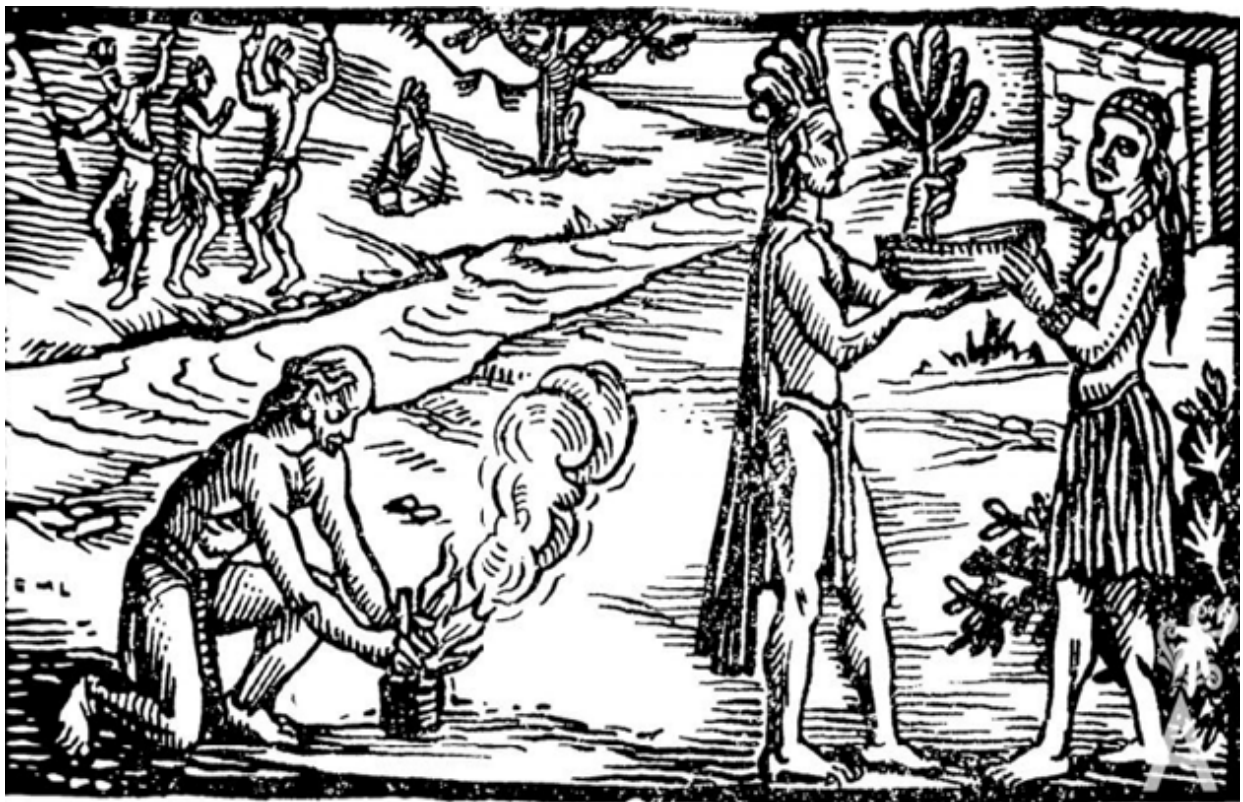
FOTO: Boda de antiguos californios

sufrido el mismo estigma por parte de visitantes ocasionales, que desconociéndolas, se atreven a aseverar que son unos flojos y que se la pasan la mayor parte del tiempo sin hacer nada. Sin embargo, al analizar datos económicos que arrojan las actividades que se practican en estos poblados pesqueros y agricultores , nos damos cuenta que son muy productivos , y que si no pueden realizar actividades durante 8 horas diarias, en todo el año es por condiciones que escapan a su control , y que alterarlas, causaría un grave daño en el medio ambiente y sus actividades productivas .