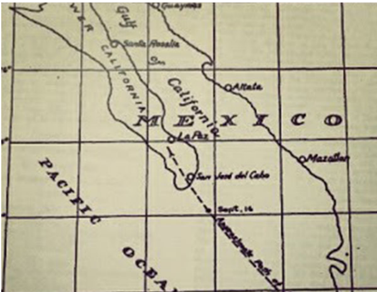
Huracán de Cabo San Lucas (1941)

Importante ciclón tropical que impactó Baja California Sur dejando 25 muertes, la mayoría en San José del Cabo ; importantes daños en la ciudad de La Paz ; así como lluvia estimada de 20 pulgadas (508 mm) en El Triunfo . Se desconoce la intensidad real del ciclón tropical por falta de variables meteorológicas en tierra. En este enlace puedes encontrar más información.