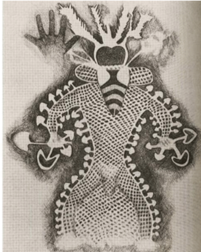
Fig. 2 Chamán con hongos. Pintura rupestre de la cueva de Tassili, Argelia.

Datación de hace 9 mil años. Reconstrucción de Kat Harrison-McKenna.