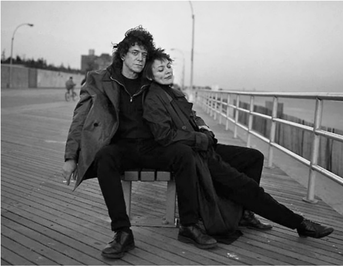
Laurie Anderson y Lou Reed.