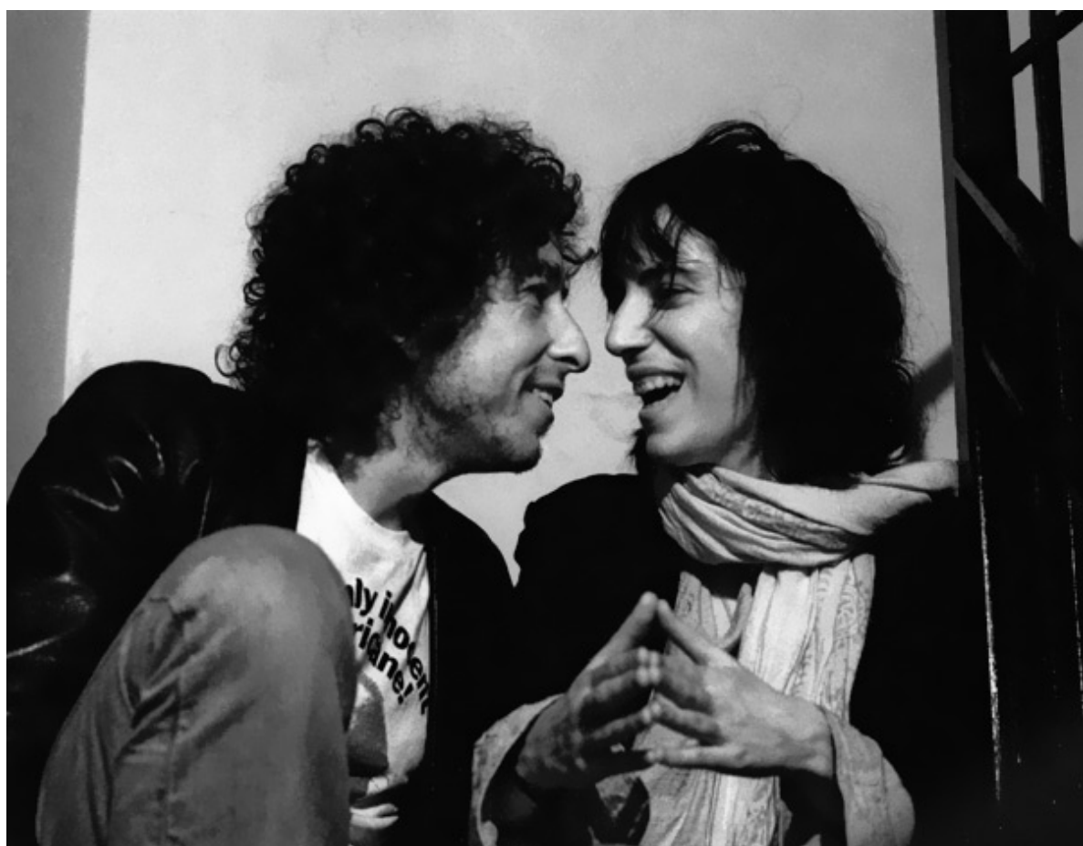
Dylan y Patti Smith.

amén del elegante reconocimiento a Dylan.