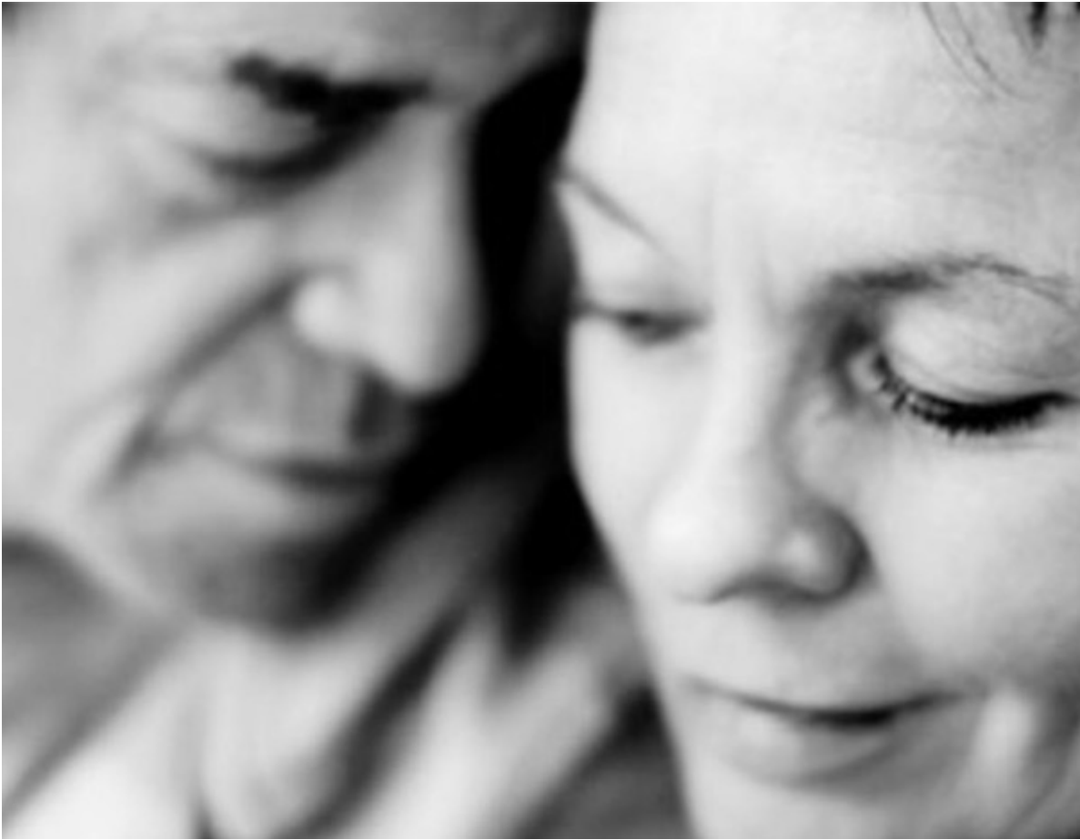
Lou Reed y Laurie Anderson.

El filme de Laurie Anderson fue estrenado en 2015 en el Festival de Cine de Telluride y en el de Venecia con el aplauso crítico casi unánime y universal. Sólo se ha mostrado en la Ciudad de México y será una ocasión espléndida poder disfrutarlo en La Paz . Por último, para cerrar el ciclo de forma magnífica, el quinto martes de noviembre, el 29, proyectaremos un documental dedicado a examinar la figura del autodenominado Profeta del nopal , Rockdrigo González , músico poeta tampiqueño –aunque defeño por vocación y adopción. El célebre músico que muriera trágicamente, según la versión chocarrera de la banda chilanga , “de un pasón de cemento” –aplastado por el concreto del edificio de Tlatelolco en el terremoto de 1985 .