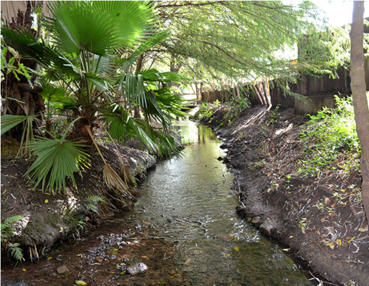
Ejemplo de una Ciénega.

El conductor ayudó a su ama a llegar al interior de la huerta, como si ambos flotaran entre nubecillas vaporosas. Don Porfirio , como se llamaba el cuidador de la ciénega , se encaminó cauteloso hacia los extraños visitantes para saber la razón de su llegada, pero se quedó mudo de terror; la carroza negra y reluciente, parecía salida de un antiguo cuento de hadas, y la presencia de la mujer, pese a su hermosura, ponía los pelos de punta. Entonces, don Porfirio vio que la dama de lúgubre presencia cortaba algunas flores, hacía con ellas un ramo y subía nuevamente, ayudada por su cochero, a la imponente carroza .