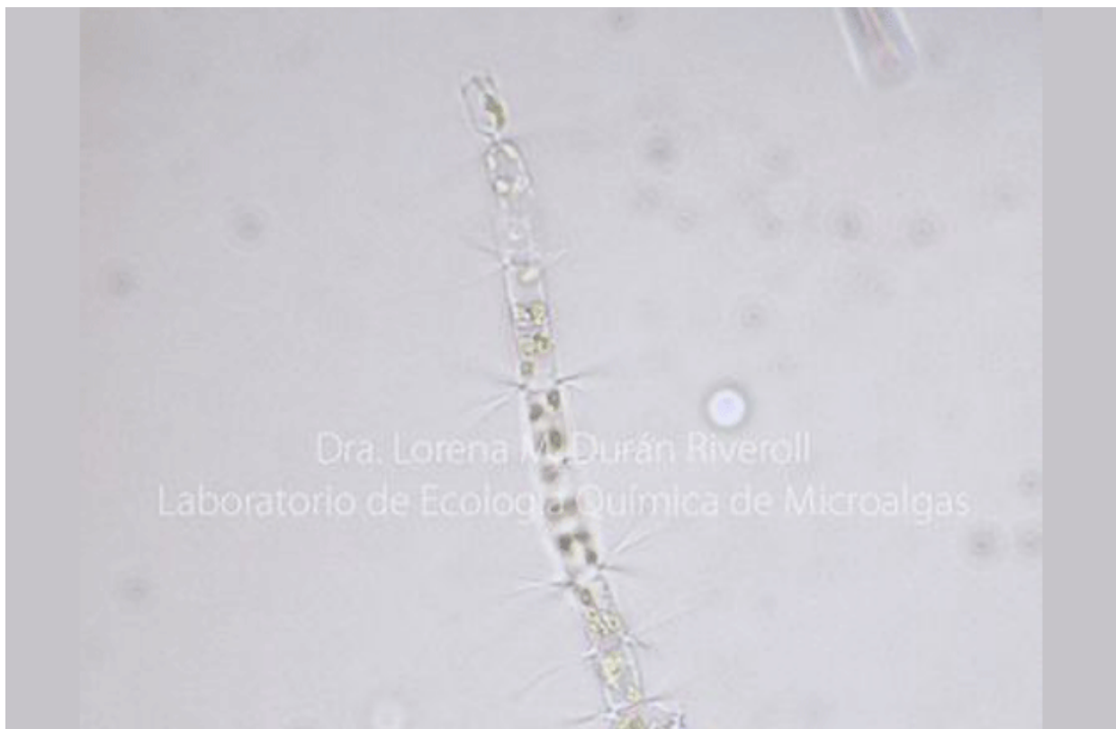
Diatomea del género Chaetoceros con sus espinas de sílice. Muestra de la Bahía de Todos Santos, Ensenada, B.C., marzo 2022.

Las microalgas son transportadas por las corrientes a todo el planeta, y están presentes en todos los mares y océanos del mundo . Pero, no se encuentran todas las especies en todos los lugares , pues su supervivencia depende de las condiciones ambientales , como la temperatura , los nutrientes disueltos en el agua y la salinidad . Por lo tanto, en distintos lugares, encontraremos distintas especies.