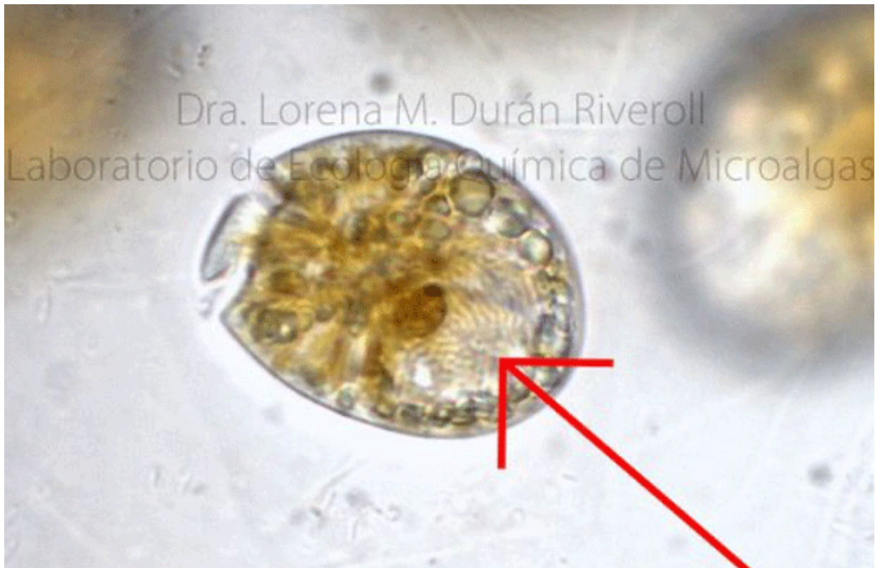
Dinoflagelado en cultivo del género Amphidinium, en el que se observa el núcleo y los cromosomas (flecha).

Por eso, cuando me asomo por la ventana y veo que el mar ha cambiado de color, me preocupo y me emociono, porque me apasionan las microalgas que forman mareas rojas y que producen compuestos cuya función y potencial aún no conocemos. Y entonces, salimos a tomar muestras para cultivarlas y seguir las estudiando. ( Aquí te comparto, una breve historia de cómo decidí dedicarme al estudio de estos organismos).