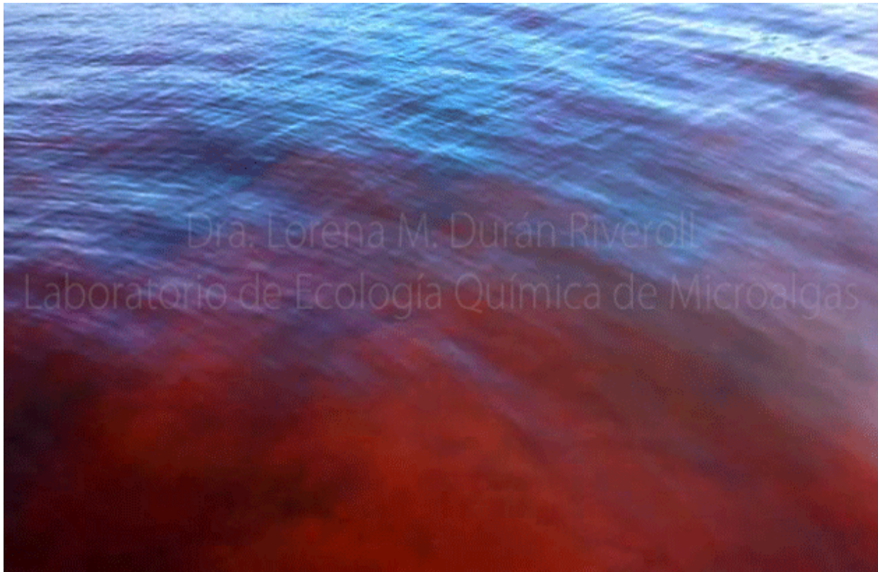
Marea roja de Noctiluca scintillans en el Golfo de California, 2016.

Las toxinas de las microalgas , pueden causar graves intoxicaciones en humanos y en diversos animales marinos como lobos, ballenas, delfines, peces y aves. Pues, estos compuestos se acumulan principalmente en moluscos como mejillones, ostiones y almejas, pero también en algunos peces, que cuando son consumidos, acarrearán las toxinas y algunas de ellas pueden ser mortales .