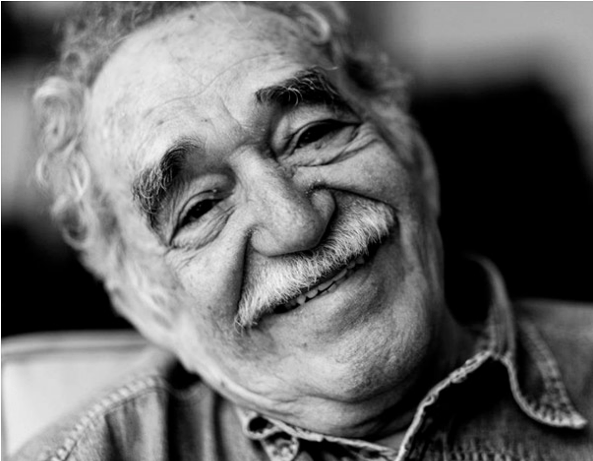
Gabriel García Márquez.

La pregunta que nos viene a la mente es: una vez instalados en el compromiso, en el contrato con la editorial, ¿perderemos la libertad de escribir cuanto tema se nos ocurra? La respuesta, en la mayoría de los casos, es sí. A la editorial no le interesan tus necesidades estéticas, tus necesidades filosóficas, o tu imaginación cuestionadora, a la editorial le interesa ganar y vender, lo cual es un hecho natural del mercado, puesto que son una empresa que viven de eso. Pero, ¿y el individuo, el escritor , dónde queda? ¿Se convierte en un trabajador, un obrero, un maquilador de las letras? ¿Ve frustrado su talento para acomodarse a las necesidades del mercado? Muchos hemos constatado que el primer libro resultó una maravilla porque no estaba sujeto a las presiones editoriales, sino a su propia entrega, carisma y capacidad de escribir. No obstante, los siguientes libros comenzaron a parecerse entre sí, pero no al primero. Algunas editoriales optan por exigirle al escritor sagas de aventuras para determinadas edades y públicos, con el fin de crear