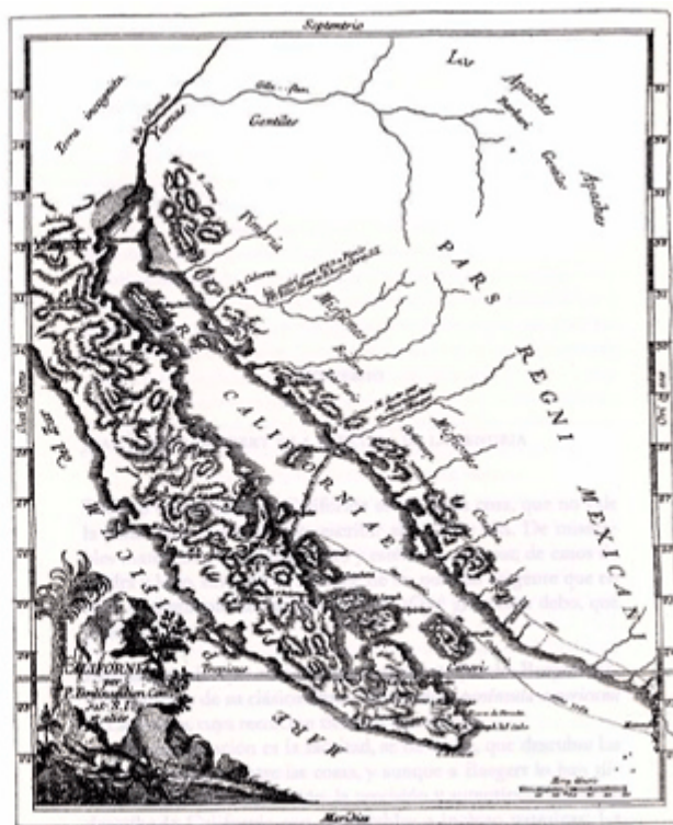
Nota: Tripla latitudo et amplius descripta hic California est, quoniam ex ipsa fit, ut foliis aspectu melius pateret sine ulla horaria mutatione, secundum longitudinem tantum California, ferre, non secundum latitudinem. Omnia etiam sunt longitudo gradus, et quod incerta illa, adhuc est.

Para leer esta obra, una persona que no tenga un entrenamiento profesional para tomar su contenido de forma estéril y libre de prejuicios, se debe de proveer de una buena cantidad de antiácidos y tés tranquilizantes, puesto que el lenguaje frío, directo, incluso considerado por muchos, grosero y producto