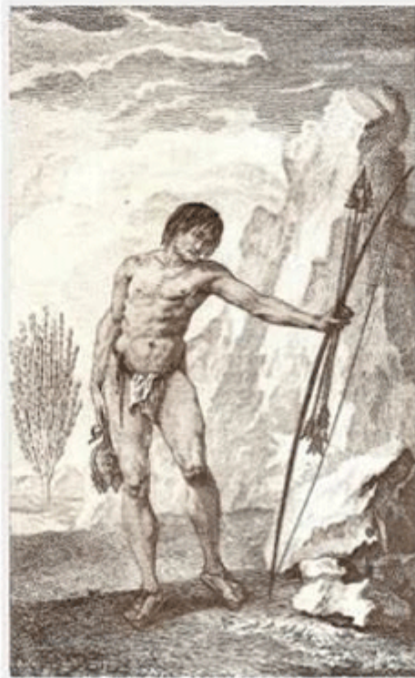
Nativo de California por Jakob Baegert en 1772.

Como ya mencionamos, la austeridad del medio ambiente peninsular así como la gran cantidad de tiempo y energía que debían utilizar para hacer las puntas de las flechas de piedra, obligó a los californios a escatimar su uso, como aquí lo describe el misionero del Barco: Mas para la guerra, o para cazar venados u otros animales grandes, aunque sirven bien las ya dichas (sólo de madera), suelen añadirles un pedernal en la punta en forma de lanceta, para que haga mayor herida y no pueda desprenderse del cuerpo herido. Este pedernal le afianzan en la punta del palo de la flecha con nervios, como lo demás que queda dicho.