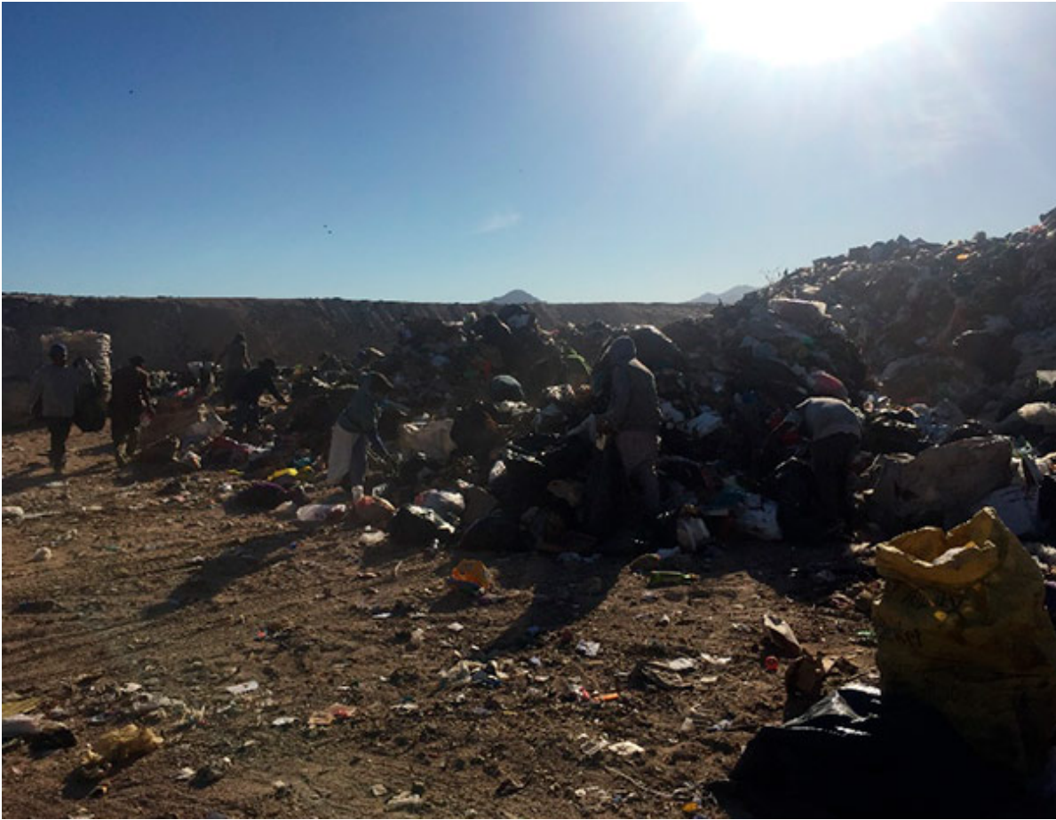
Seleccionadores de basura en acción.