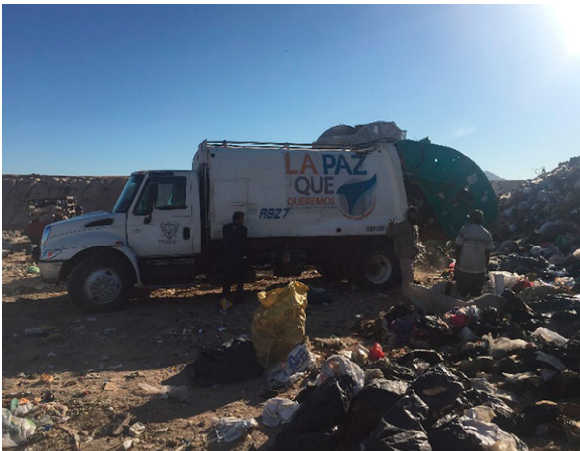
Seleccionadores de basura esperando la descarga del camión.

materiales y los revuelven en el camión? Bajo las circunstancias actuales, me parece que cuando intentamos ayudar al reciclaje, sin el apoyo de la autoridad, estamos tirando a la basura el conocimiento. Porque, al contrario, cuando reciclamos lo hacemos para transformar sociedad, cultura, pensamientos, actitudes, materiales... y para hacer posible el planteamiento de políticas claras, proyectos interesantes y motivantes e investigaciones que conlleven a dar una segunda función útil a los residuos sólidos para que su disposición final no sean los rellenos sanitarios.