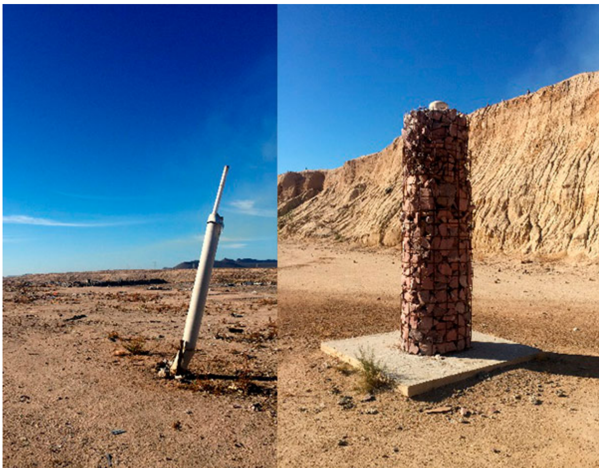
Respiraderos de biogás. Respiradero en la cima de una trinchera clausurada y respiradero de la nueva trinchera

Por su parte, los lixiviados en los vertederos de basura, son los líquidos resultantes de la descomposición de los residuos, ósea el “caldito de la basura”. El control de lixiviados es de suma importancia porque su filtración al subsuelo puede contaminar los mantos acuíferos. En el relleno sanitario paceño , la nueva trinchera nos permitió observar la manera que tienen en este sitio de hacer frente a este problema: una geomembrana. Esto no quiere decir más que una capa gruesa de plástico impermeable, enterrada al fondo de la trinchera, que permite retener los líquidos. Su efectividad quedó demostrada en nuestra fotografía del agua acumulada por las últimas lluvias de noviembre que aún se observa al fondo de la trinchera vacía.