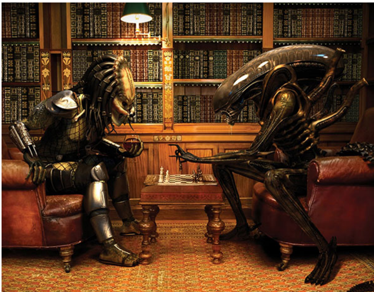
IMAGEN: Benjamin Parry