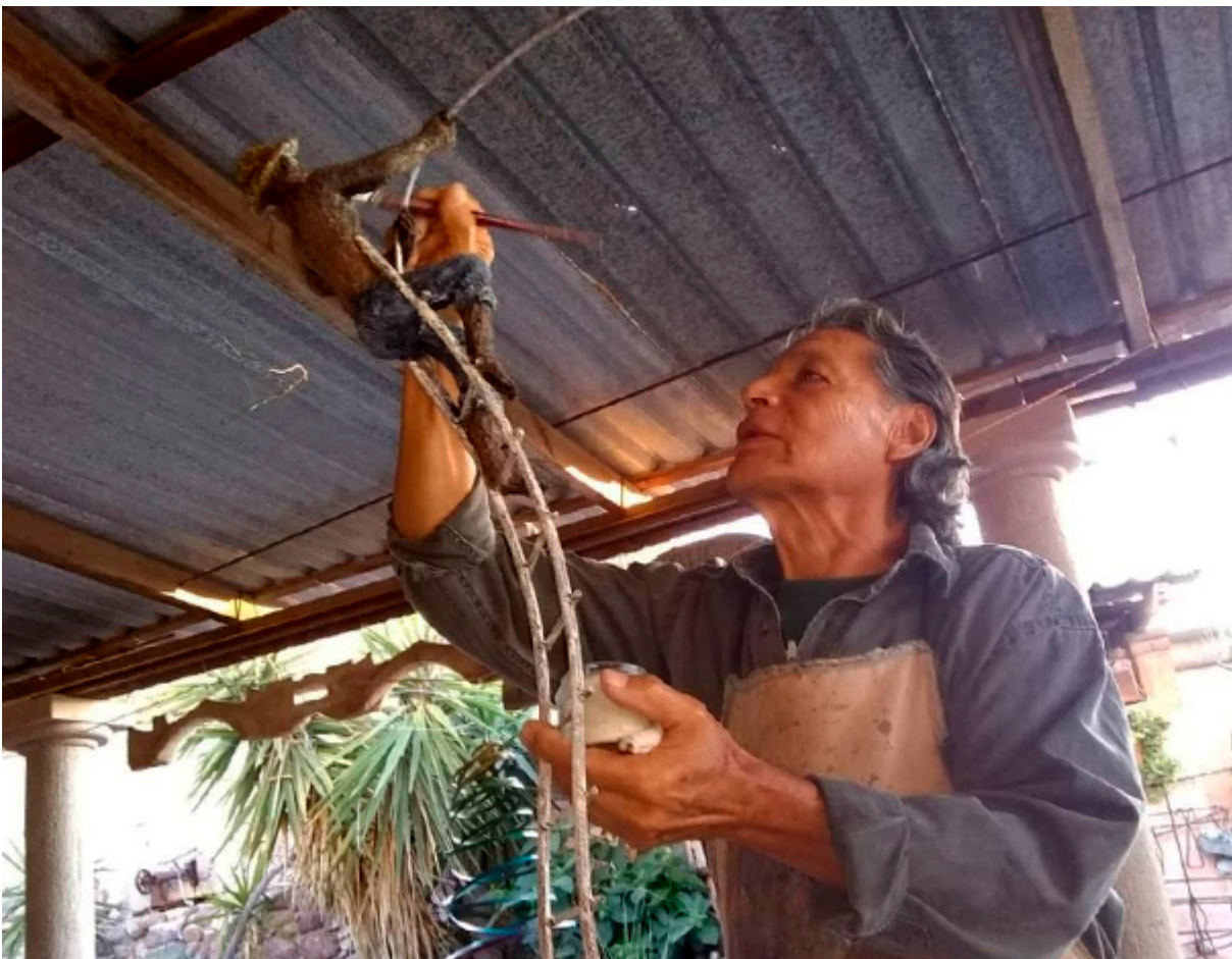
La puerta sin autor

Sabiendo de los antecedentes de su papá, me invitan a participar a exponer, yo tuve el atrevimiento de poner en dos ocasiones la obra, y ahora no lo volveré a hacer porque yo no nací para vivir del arte, el arte me hace vivir. En 2006, ganó el primer lugar en pintura en el Art Air . Esto no me hace mejor artista, simplemente fue algo casual, pero viví esa gran aventura. ¿Y la Cola de la Ballena , sería su obra maestra? Le pregunté. No, si tú me volvieras a preguntar o alguien me preguntara cuál es la mejor obra que considero, yo diría que hasta este momento no he encontrado lo que sigo buscando. Si yo dijera que esta o aquella es mi mejor obra, entonces no tendría sentido seguir insistiendo. Por fortuna, todos han sido pequeños trayectos, también hay errores, pero sigo perseverante. A este momento creo que no, y no creo que llegue a considerar un día alguna de mis obras como maestras, no hay tal.