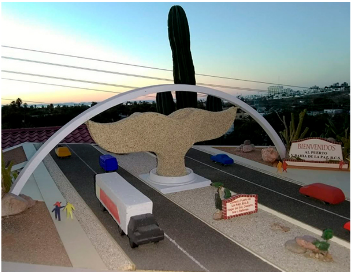
A pesar de ser, quizás, el monumento más emblemático de La