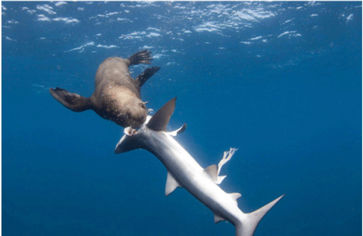
Un lobo marino devorando a un tiburón azul

El mar no sólo un paisaje tranquilo o tempestuoso, también es un campo de batalla, un coliseo donde millones de seres se devoran unos a otros sin piedad y en concierto. Así, la voluntad de sobrevivir es el único objetivo de la materia ordenada que lucha contra la entropía inmisericordemente.